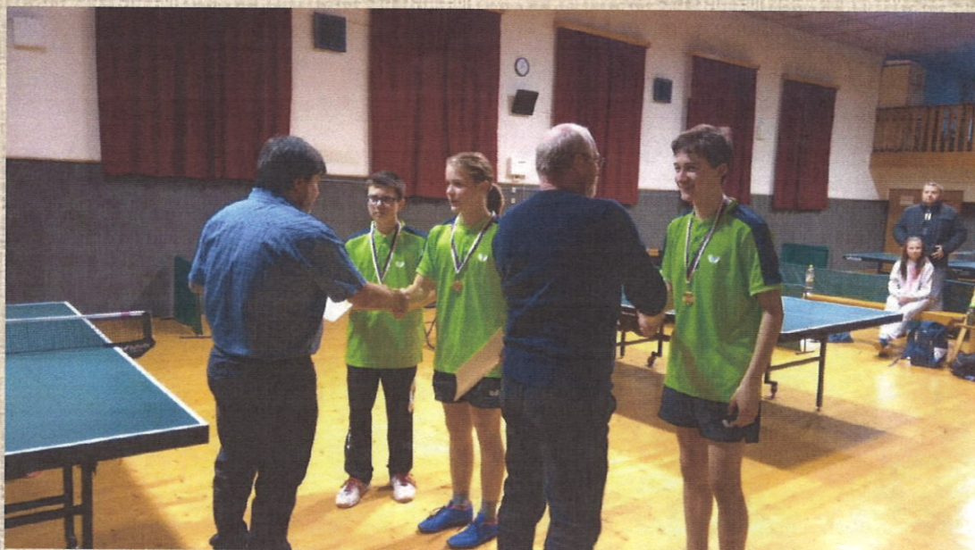
Dekorování vítězů Krajského přeboru družstev starších žáků