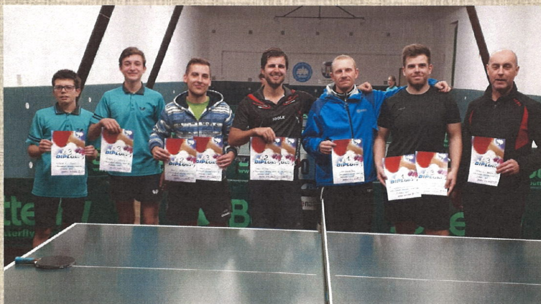
Dobřanští medailisté z Regionálního přeboru mužů